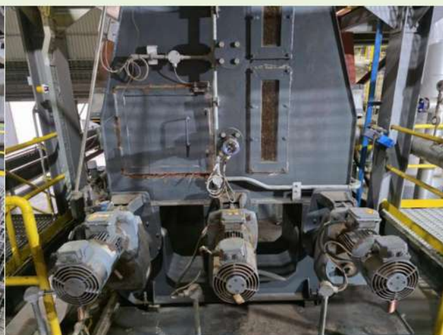
Fig. 8 進料分配器