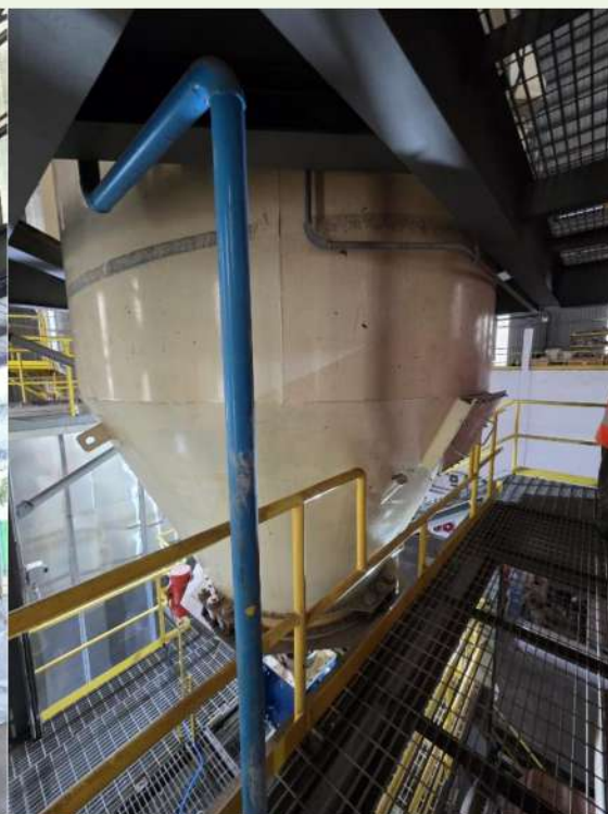
Fig. 6 燃料倉