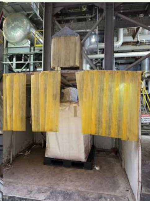
Fig. 13 底灰