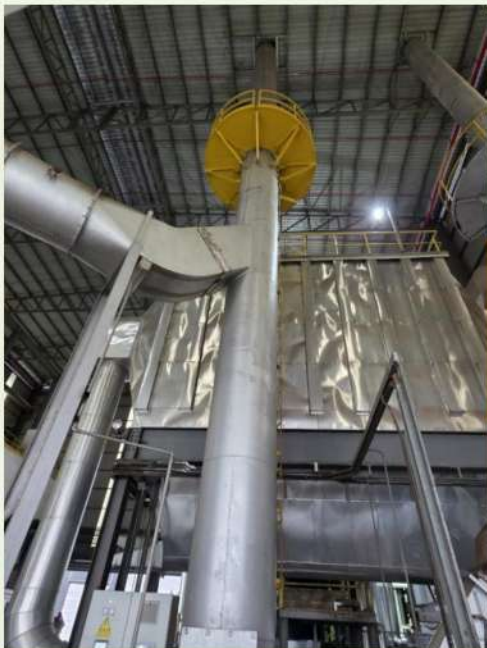
Fig. 12 防治設備與排放口