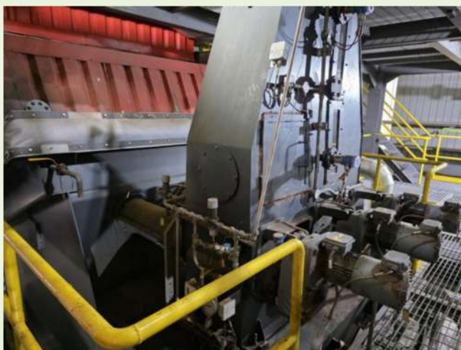
Fig. 7 螺旋進料機