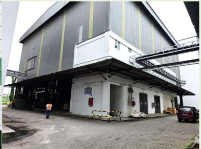
Fig. 2 JB COCOA 生質能源廠

生產可可產品過程中產生大量衍生廢棄物，主要為可可豆莢殼(cocoa pod husk, CPH)、可可膠(也稱為果肉)和可可豆殼。可可豆莢殼是成熟果實去除可可豆和胎座後剩餘的莢果物質，約佔整個果實的 70~80%。可可豆殼是包裹可可豆的外層，約佔可可豆總重量的 10~20%。可可豆外皮在巧克力工廠的可可豆烘焙過程中被回收，也就是說每生產 1 公斤巧克力，就會產生近 100 公克可可豆外皮(Sánchez et al., 2023)。整個可可產業中約有 90%可可果實重量的殘渣產生，而只有 10%的產品產出。這不僅會帶來環境影響，也會產生廢棄物處理所需的管理及成本支出。據估計，全球每年產生 70~90 萬公噸可可豆殼。這種副產品的堆積造成嚴重的經濟和環境問題需要解決(Cantele et al., 2020)。圖 3 說明可可加工步驟及其副產品(Porto de Souza et al., 2022)。