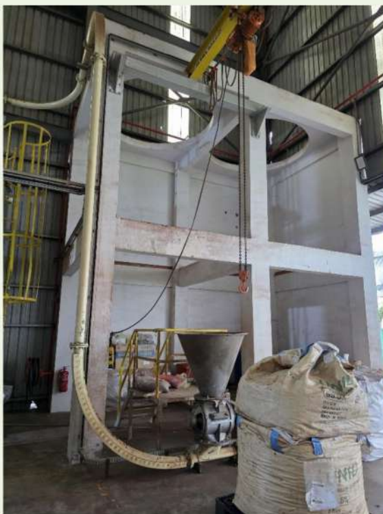
Fig. 5 燃料氣送系統