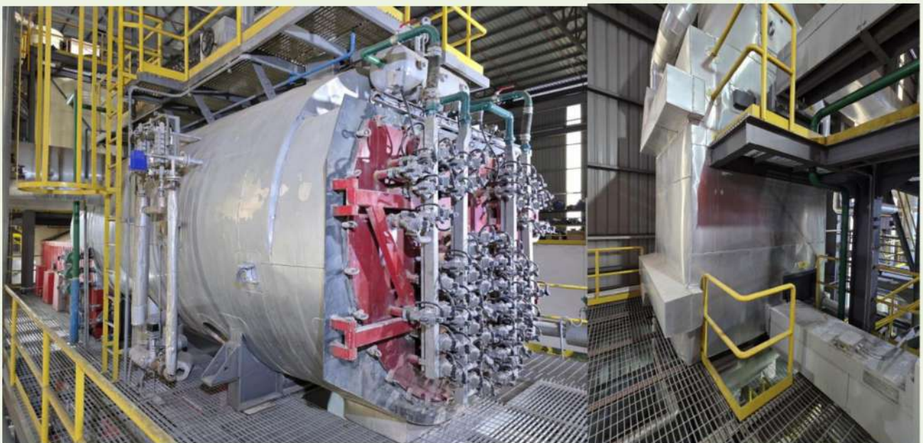
Fig. 10 煙管式鍋爐