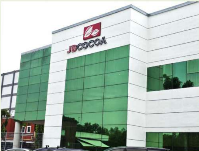
Fig. 1 JB COCOA

JB Cocoa 是 JB Foods Limited 旗下的高端可可原料品牌，產品包括可可塊、可可脂和可可粉，是巧克力、巧克力糖果以及各種可可相關食品和飲料生產的原料，產品出口到全球 65 個國家。2024 年年產能為 21 萬公噸，為世界知名可可原料供應商(JB Cocoa, 2025)。JB Cocoa 的可可加工廠位於馬來西亞柔佛州(Johor)物流樞紐一丹戎帕拉帕斯港(Port of Tanjung Pelepas, PTP)的自由貿易區內。該廠於 2003 年完工投產，為其主要生產工廠。生產過程中產出大量廢棄可可豆殼(cocoa bean shell, CBS，後簡稱可可豆殼)，造成衍生之廢棄物處理問題，此外使用柴油做為製程中熱源的燃料，其成本高昂且燃燒化石燃料會產生大量溫室氣體。