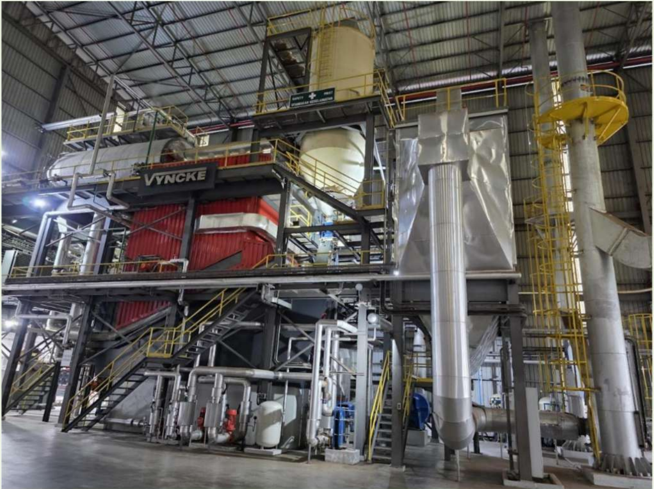
Fig. 9 JB COCOA 生質能鍋爐