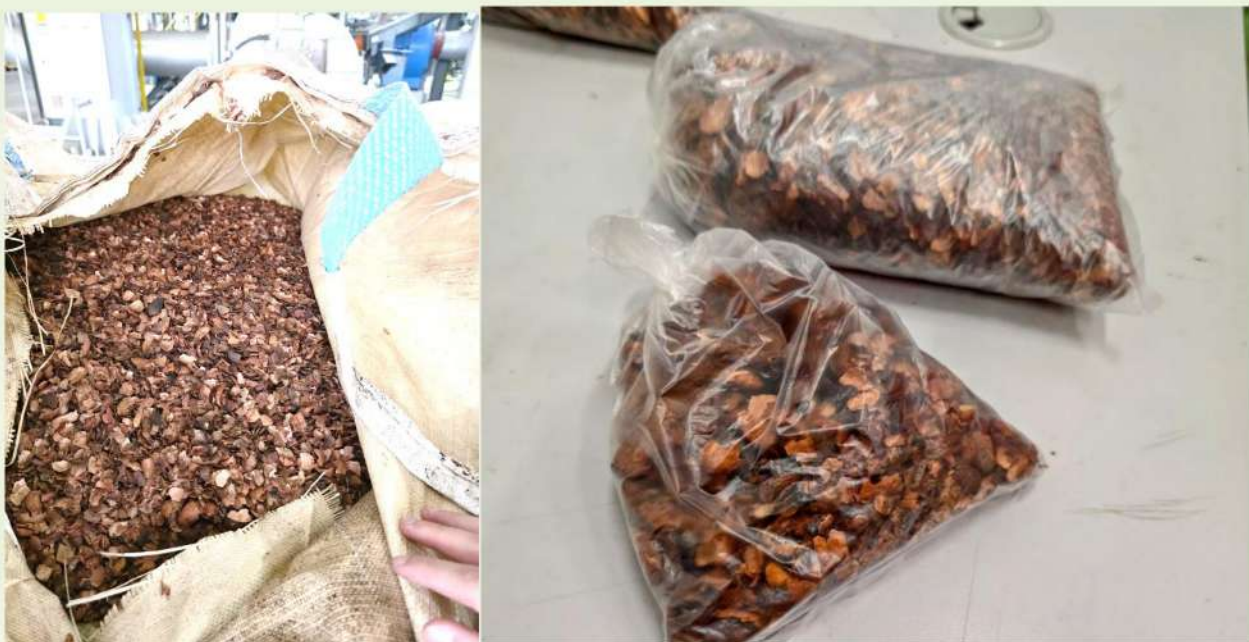
Fig.4 廠內產出之可可豆殼